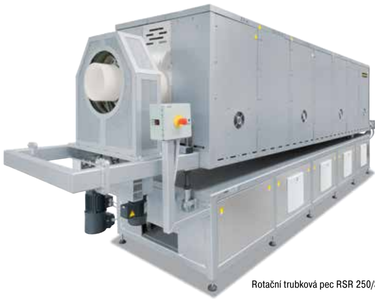
Rotační trubková pec RSR 250/3500/15S