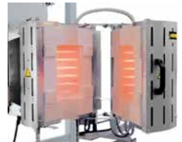
RS 100/250/11S ve vyklápěcím provedení pro montáž do zkušebního zařízení

Na bázi našich základních modelů vypracujeme individuální varianty i pro integraci do nadřazených procesních zařízení. Řešení vyobrazená na této straně jsou jen zlomkem možností. Od prací ve vakuu nebo v ochranné atmosféře přes inovativní regulační a automatizační techniku až po nejrůznější teploty, velikosti, délky a vlastnosti pecí – najdeme správné řešení pro vhodnou optimalizaci procesů.