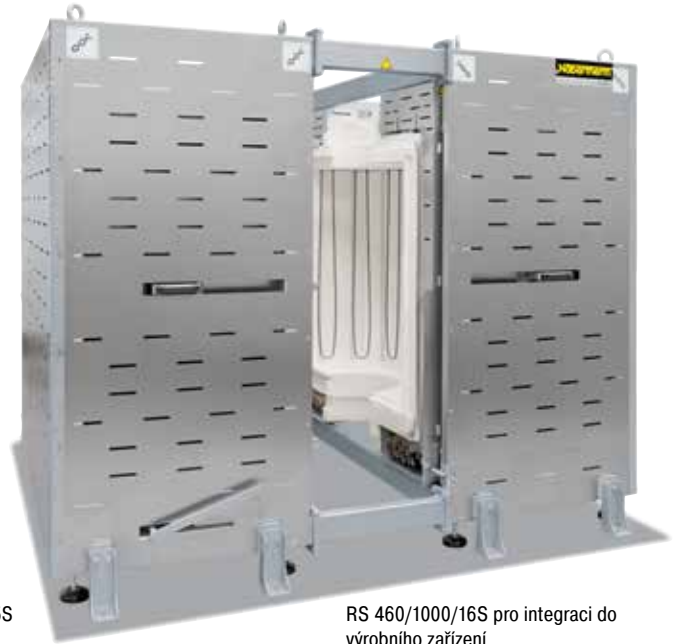
RS 460/1000/16S pro integraci do výrobního zařízení

Díky vysokému stupni flexibility a inovace nabízí Nabertherm optimální řešení pro zákaznické aplikace.